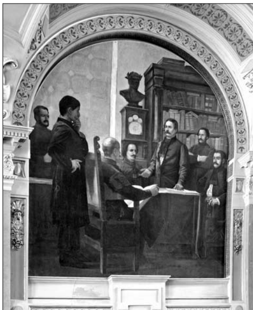
Deák Ferenc előterjeszti a büntetőtörvény-javaslatot.

Fesztynek ezen a hatodik képén láthatjuk „Magyarország hét bölcsét”, ahogy őket a kortársak elnevezték. A kép központi alakja Deák Ferenc, a törvényjavaslat előterjesztője. A bizottság tagjai között van báró Eötvös József, Klauzál Gábor, Szemere Bertalan, Szalay László, Pulszky Ferenc és Bezerédj István.